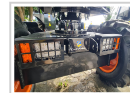
Con iluminación LED de alta intensidad para trabajos nocturnos