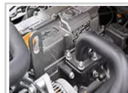
Motor diésel Yanmar