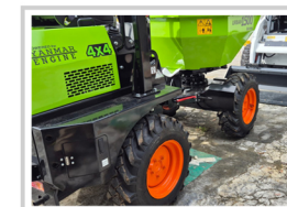
Bomba hidráulica Danfoss, tracción en las cuatro ruedas