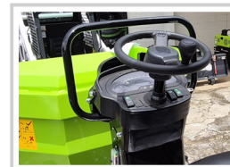
Panel de control con microcomputadora integrada que permite realizar varias funciones como operación, monitoreo y alarma