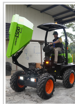
La tolva controlada por cilindro hidráulico