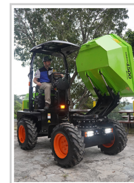
Puede inclinarse hacia adelante, hacia la izquierda y hacia la derecha