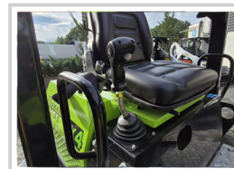
Mecanismo de retroceso con función de bloqueo neutral que garantiza un arranque seguro de la máquina