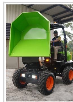
La tolva puede girar 180°