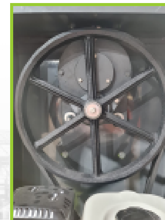
Transmisión especial que regula las RPM del motor para alargar su vida útil y hacerlo más silencioso