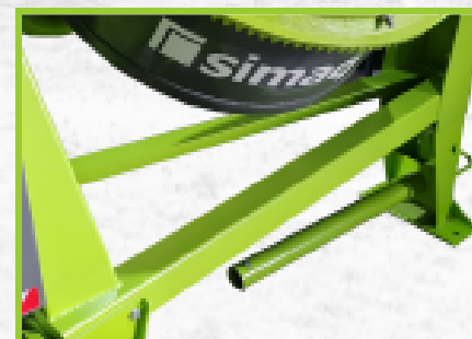
Chasis inferior en V reforzado