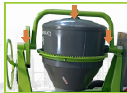
Puntos de engrase para mejor funcionamiento