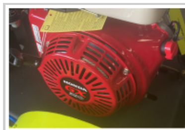
Motor de alta potencia GX390 Honda super confiable