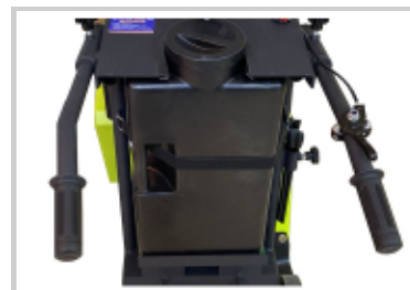
Manerales ajustables en longitud y ángulo para mayor ergonomía del operador