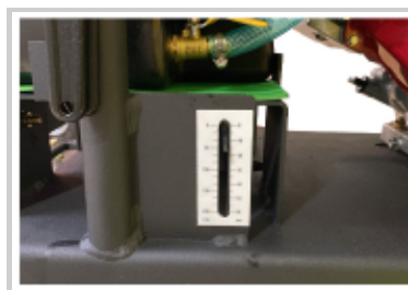
Marcador de altura de corte para regular y estandarizar la profundidad de corte y mayor durabilidad del disco