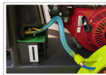
Sistema de enfriamiento, elimina el sobrecalentamiento del disco