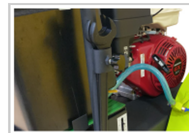
Incluye juego de herramientas incorporadas al equipo para fácil cambio de discos